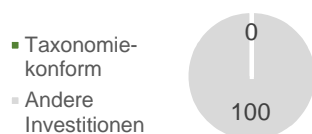
1. Taxonomie-Konformität der Investitionen einschließlich Staatsanleihen*